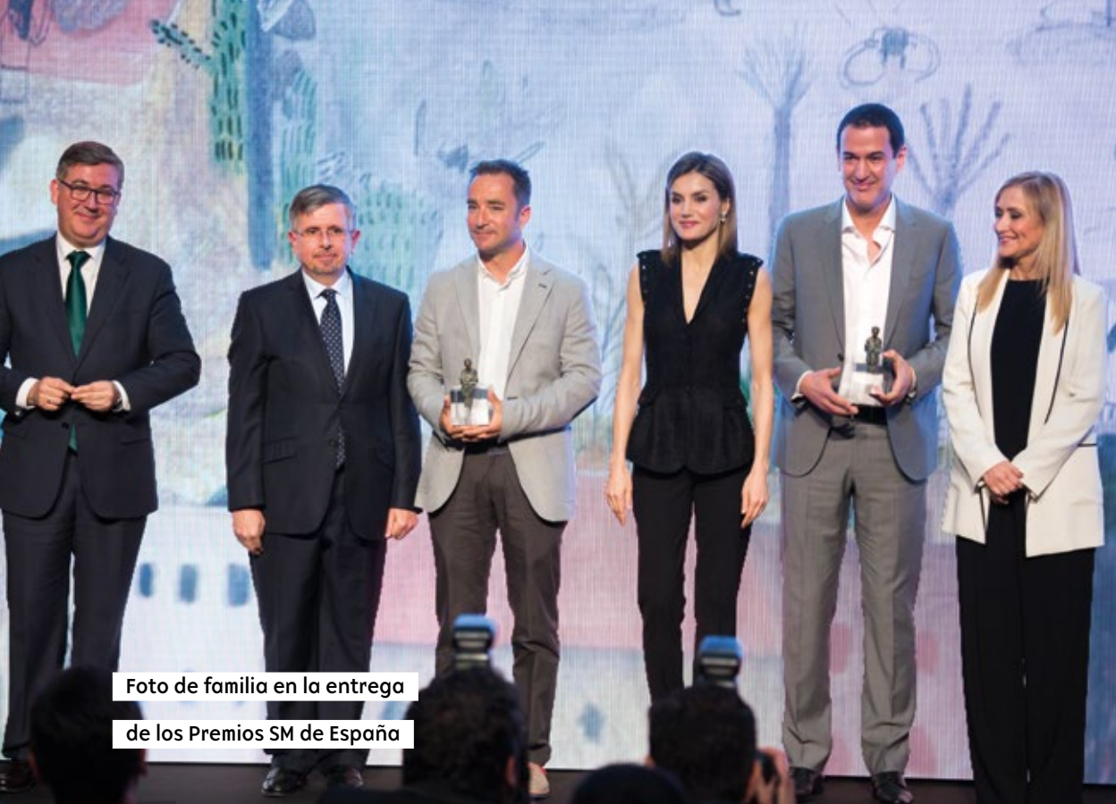
Foto de familia en la entrega